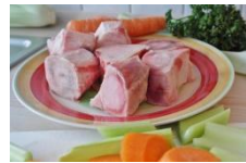
kości na zupę

Uwaga dla grafika: W trakcie podawania informacji przez lektora na ekranie pojawiają się ilustracje.