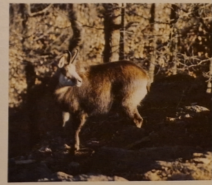
Czy uda ci się zobaczyć kozicę z aż tak blisko?