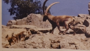
Samiec koziorożca z dwójką młodych

Kozica i koziorożec to prawdziwi górale. Lubią duże wysokości i skaliste zbocza i żadne zwierzę nie może się z nimi równać.