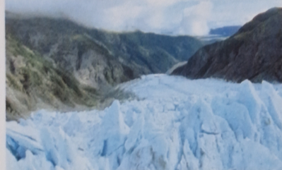
Lodowiec w alpejskiej dolinie.