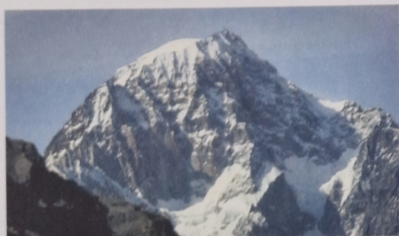
Mont Blanc (4810 m n.p.m.) – najwyższy szczyt Alp.