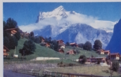
Wioska turystyczna u podnóża Alp.

Powyżej wysokości 2900 m n.p.m. w Alpach jest już tak zimno, że przez cały rok może utrzymywać się pokrywa śnieżna, która tworzy lodowce.